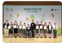
青苗學界進步獎頒獎典禮